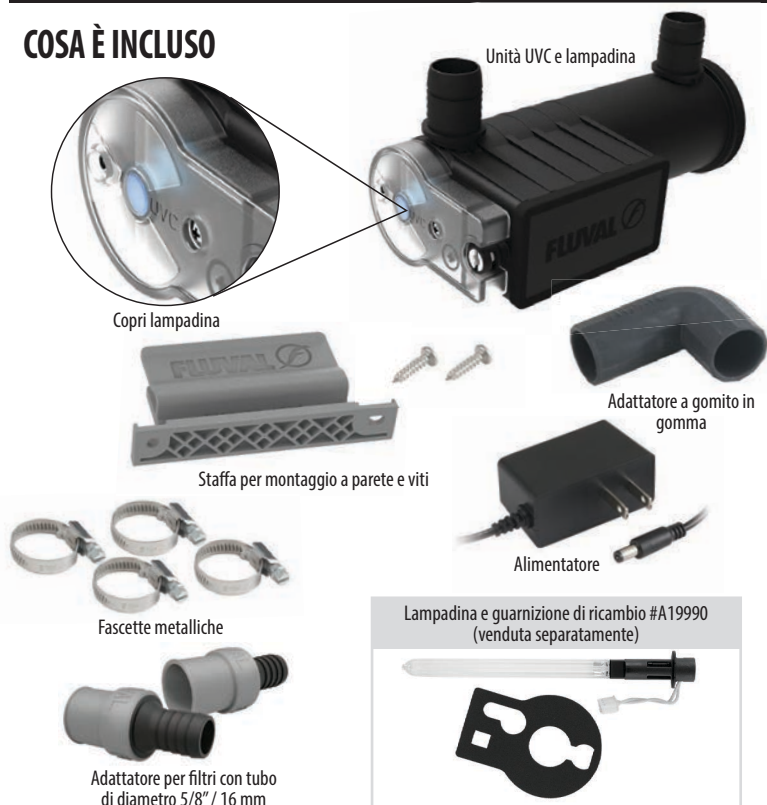
Unità UVC e lampadina